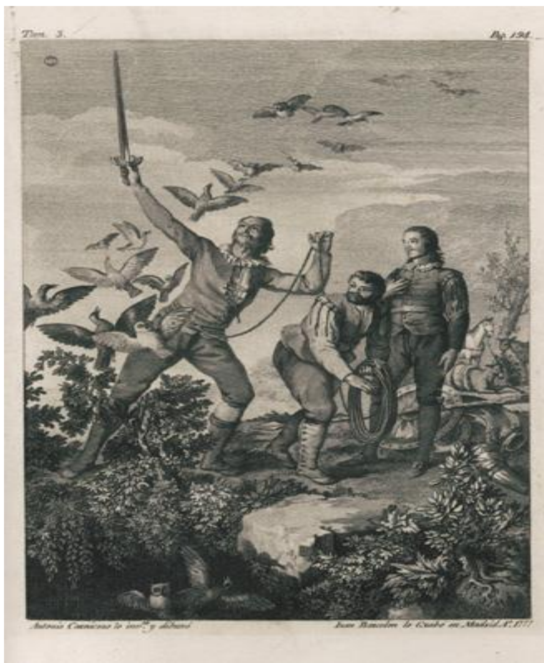
Fig. 3: Carnicero, Antonio. Aventura en la cueva de Montesinos . 1780. Ed. Julio Polino Tamayo. Carnicero sigue las instrucciones al pie de la letra, según la éfrasis inversa, y crea una imagen visual de un texto verbal. Desde la postura de don Quijote hasta los detalles de su vestimenta,

estará Rocinante, y en el suelo se verá la armadura de D. Quixote, el escudo y la lanza (ctd. en Martínez Ibáñez 26).