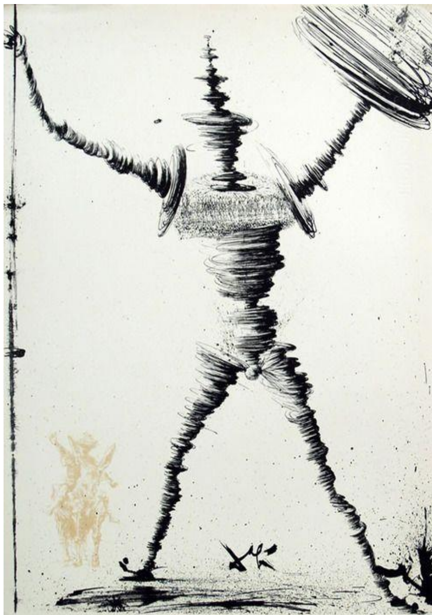
Fig. 8: Dalí, Salvador. Don Quichotte . 1957. Paris.

Esta figura abstracta creada en el ámbito del surrealismo representa el espíritu luchador del caballero, su motivación para seguir adelante y no detenerse a pesar de las derrotas. La figura en tinta, a pesar de no tener un rostro expresivo con facciones que delatan su actitud y pensamientos, es altiva y motivada, recta y con una postura firme y equilibrada que invita a seguirle y a combatir junto a él. Al atreverse a ser quien es y actuar como él desea, se le multiplican los peligros y lo convierten en un personaje más importante y valeroso que los otros