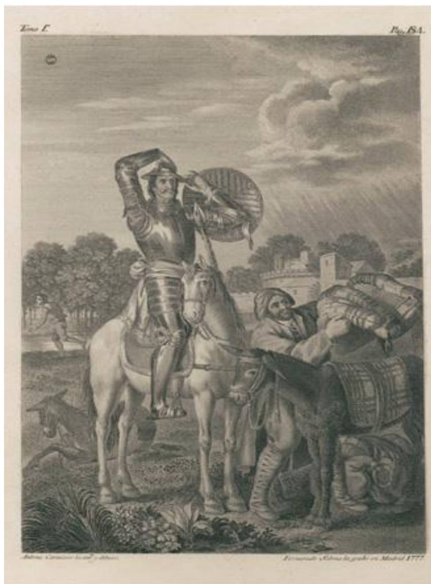
Fig. 1: Carnicero, Antonio. Don Quijote gana el yelmo de Mambrino . 1780. Ed. Julio Polino Tamayo.

capítulo don Quijote en su locura confunde una bacía que lleva un barbero sobre la cabeza para protegerse de la lluvia con el ficticio yelmo de Mambrino. Sancho trata de convencerlo de que no es así. A los ojos de don Quijote, el hombre que se acerca a ambos posee algo de increíble valor y significado, mientras que Sancho ve lo que realmente es.