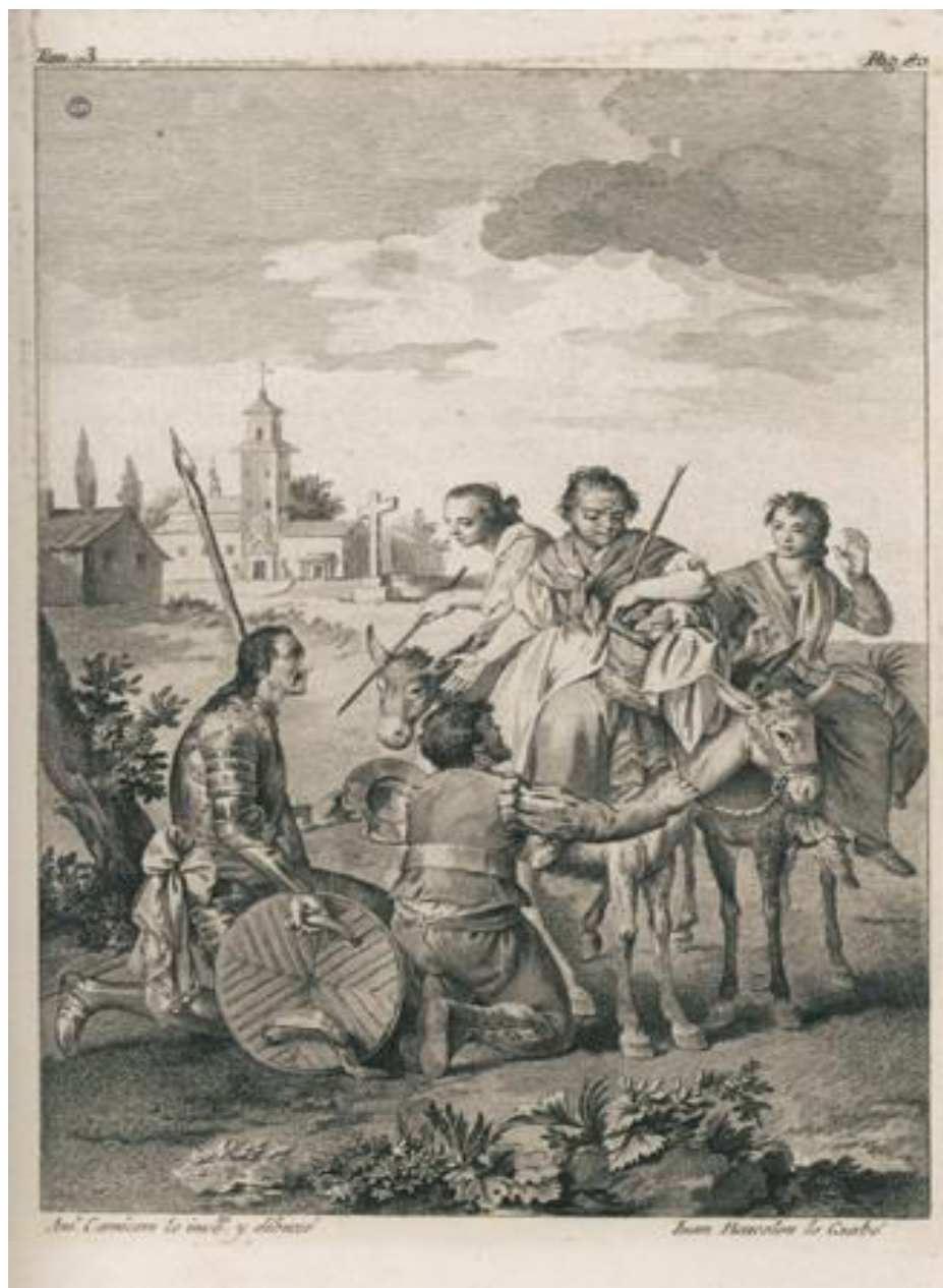
Fig. 2: Carnicero, Antonio. La Dulcinea encantada . 1780. Ed. Julio Polino Tamayo.

mientras que Sancho parece pedir la bendición de una de las labradoras. El cuerpo del caballero evoca una especie de derrota, parece caído, casi vencido por la incredulidad.