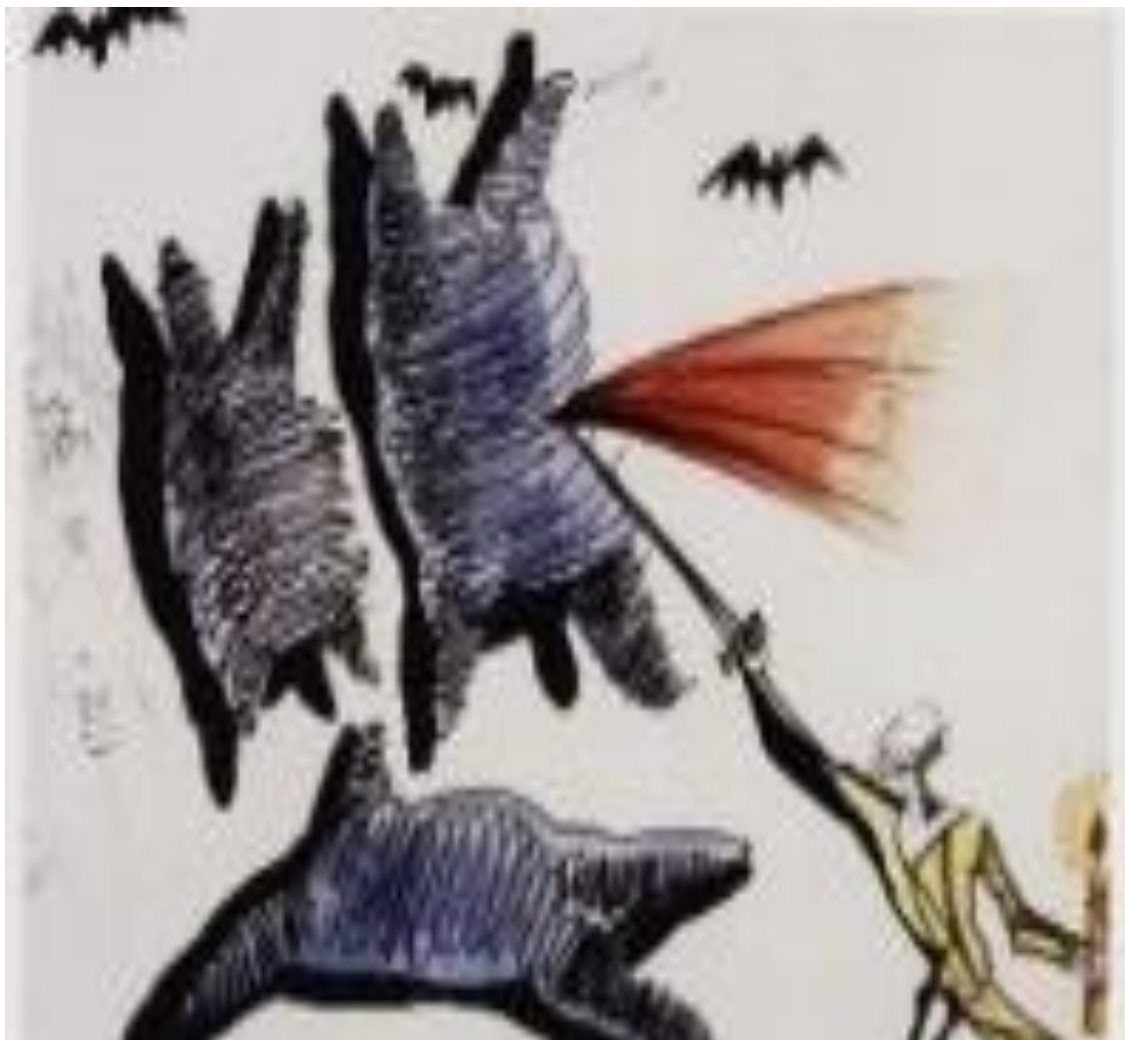
Fig. 9: Dalí, Salvador. Don Quijote - Ink and watercolor. 1977-78.

carácter mimético respecto a la realidad” (Azzaretti 111). Dalí capta la esencia quijotesca del personaje, elige correctamente los diferentes rasgos que definen a don Quijote y los añade a su mundo abstracto.