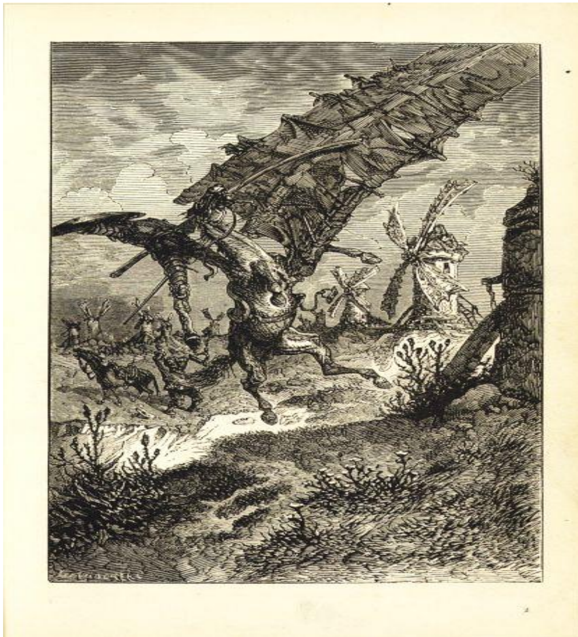
Fig. 5: Doré, Gustave. The attack on the windmill . 1867.

La composición artística coloca en el centro a don Quijote y a Rocinante dibujados con mucho realismo y atención al detalle, pero no permite que el observador vea la cara del caballero. Esto le ofrece libertad al lector de imaginarse la expresión facial del héroe derribado. Sin embargo, le presenta una pista. Aunque no se puede apreciar el rostro del Caballero de la Triste Figura, en la expresión de Rocinante se puede detectar sorpresa y sufrimiento, no solo a