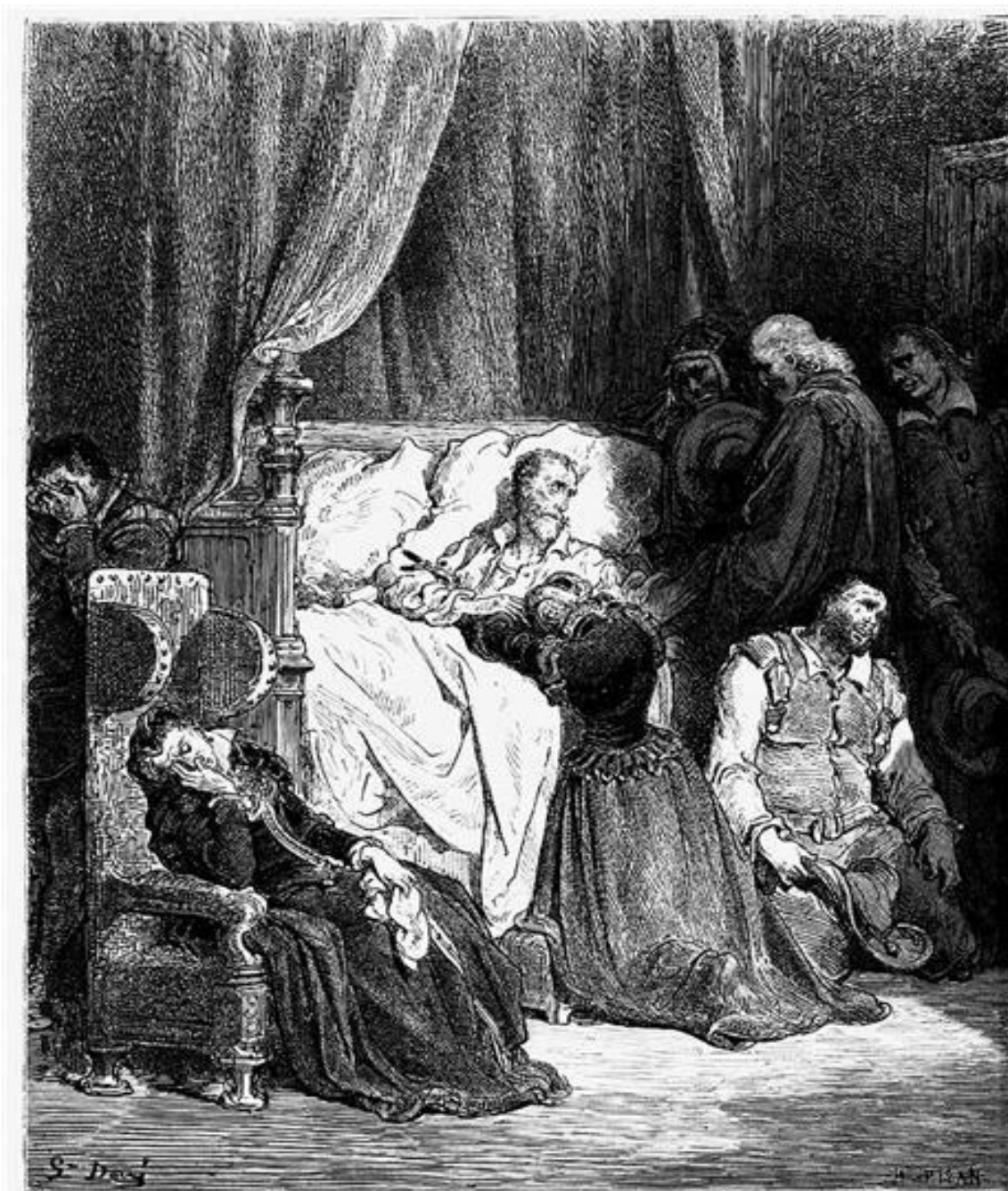
Death of Don Quixote (II, 74).

hacer hincapié en que ya no es el mismo de antes y resaltar que es consciente de que sus acciones estaban basadas en su locura y ambición.