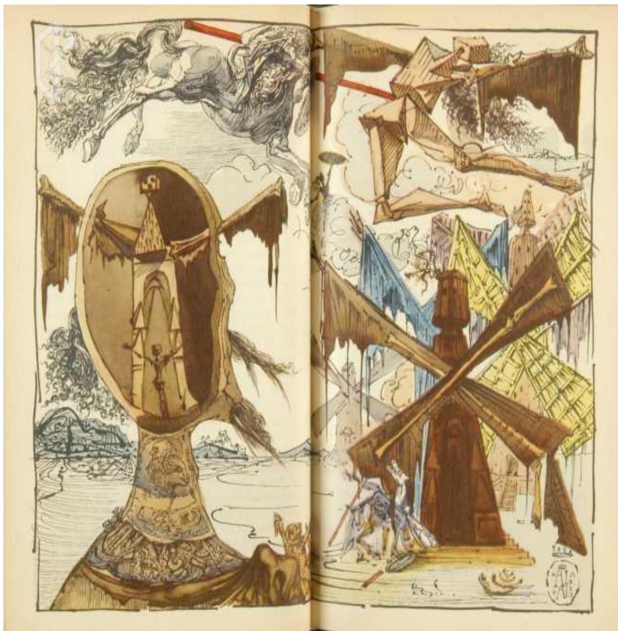
Fig. 7: Dalí, Salvador. Don Quixote and the windmills . 1946. New York.

distintas cosas provenientes del mundo de fantasía de sus libros y no es la realidad. Dalí pinta la realidad del mundo exterior al lado derecho y la imaginación de don Quijote que distorsiona la realidad que vive al lado izquierdo.