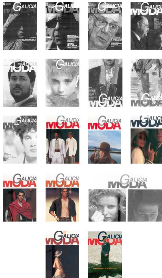
Fig. nº 3: Portadas revista Galicia Moda