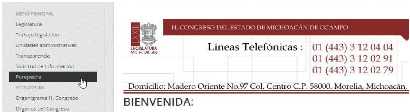
Figura 2. Portal del Congreso del Estado de Michoacán de Ocampo