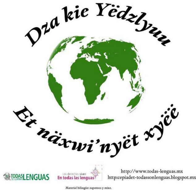
Figura 1. Imagen en Zapoteco y Mixe en la página de Facebook del municipio de San Juan Yatzonas, Oaxaca.