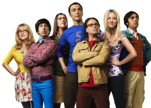
Imagen 1. Protagonistas principales de la serie de TV The Big Bang Theory

sus padres pudo estudiar en EUA y ser científico. En este mensaje, se podría entender que Estados Unidos de Norteamérica da apertura a la inclusión de extranjeros en el ámbito de la ciencia, pero al final de cuentas, formados en ese país y laborando allí, lo que da cuenta de una de las determinaciones sociales laterales, de las que Moscovici (1979) hizo mucho énfasis, como influyentes en la formación de representaciones sociales. En la Imagen 1 se observan algunos de los detalles mencionados.