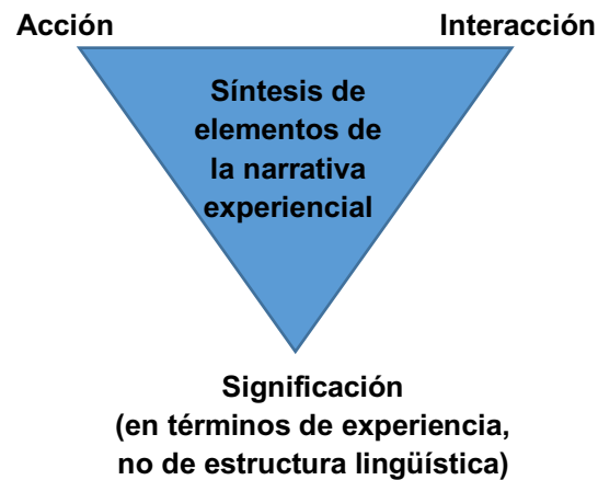
Figura 2. Constitución de los elementos de la narrativa experiencial