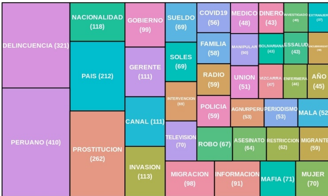
Treemap para el grupo “Venezolana”